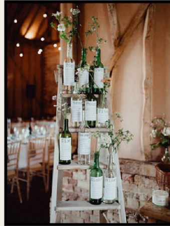
ESCABEAU ÉLÉGANT BLANC