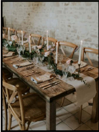
TABLE EN BOIS BRUT