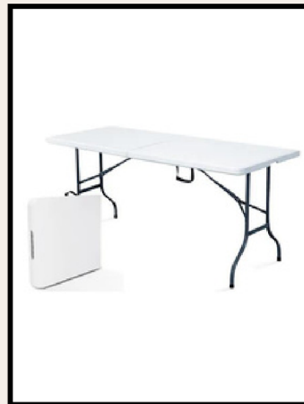
TABLE PLIANTE BLANCHE