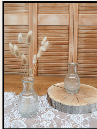
VASE À GRAVURES ROND