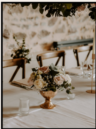
COUPE DE FLEUR DORÉE