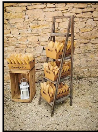
ÉTAGÈRE PRÉSENTOIR BOIS