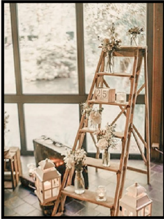
ESCABEAU ÉLÉGANT BOIS