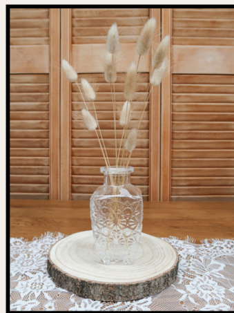
VASE À GRAVURES CARRÉ