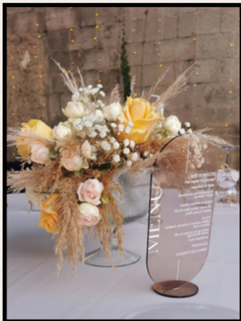
COUPE DE FLEUR TRANSPARENTE