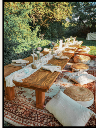
TABLE AU SOL EN BOIS