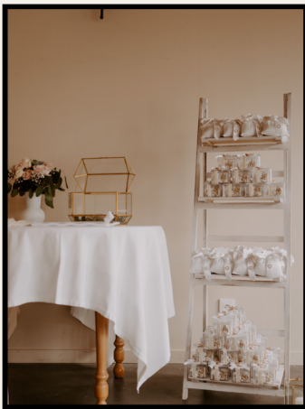
ETAGÈRE PRÉSENTOIR BLANCHE